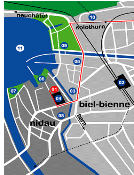
1 Lago Lodge / 2 Bahnhof Biel-Bienne / 3 Hotel Continental / 4 BKW (Bernische Kraftwerke) / 5 Shell Tankstelle / 6 Strandbad Biel / 7 Strandbad Nidau / 8 Schloss Nidau / 9 Deutsches Gymnasium / 10 Standseilbahn Magglingen / 11 Bielensee